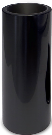
Fig. 1: Bulones del pistón con revestimiento DLC

La capa DLC se aplica mediante el método de separación física de fases gaseosas (PVD – Physical Vapor Deposition). El método PVD se emplea en la construcción de motores desde hace más de 20 años para el revestimiento de los cojinetes sputter.