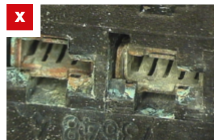
Fig. 5: Corrosione sui contatti