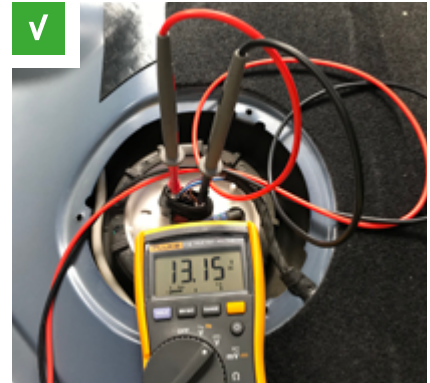
Fig. 2: Contatto elettrico a innesto sul coperchio del modulo alimentazione carburante

Nei veicoli moderni, dotati di alimentazione del carburante “regolata” o “in funzione del fabbisogno”, la pompa di alimentazione carburante viene attivata dall'apposita centralina di comando tramite un segnale a modulazione dell'ampiezza degli impulsi. Per testare questo tipo di sistemi non è sufficiente un comune multimetro digitale, poiché questo strumento consente di misurare soltanto il valore medio della tensione su un determinato periodo. In questo caso serve un oscilloscopio.