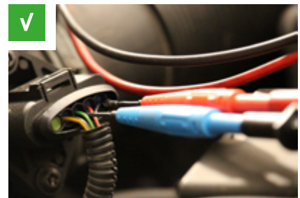
Fig. 3: Punte di misurazione sul retro del connettore