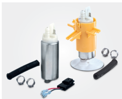
Falls erforderlich, liegen den Ersatzteilkits die benötigten Hilfsmittel bei