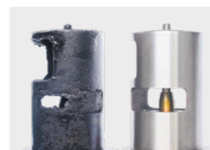
Zaklejeny i nowy zawór EGR (silnik wysokoprężny)