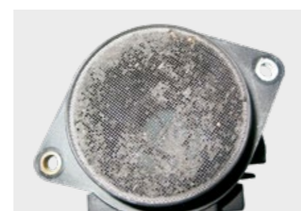
Zatkany przepływomierz powietrza (LMS)