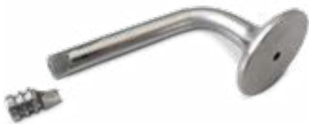
Rys. 1. Pęknięcie przeciążeniowe przy podcięciu

Po kolejnych naprawach głowicy dochodzi w krótkim czasie do pęknięcia zaworu w okolicy zamka (Rys. 1). Dotyczy to szczególnie zaworów o średnicy trzonka 7 mm i mniejszej.