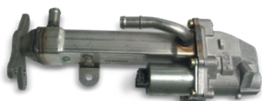
Fig. 1: Valvola EGR con radiatore EGR

Per evitare lunghe e costose riparazioni al motore durante la ricerca di una perdita di refrigerante, prima di aprire il motore si consiglia di controllare attentamente se il difetto di tenuta riguarda il radiatore EGR.