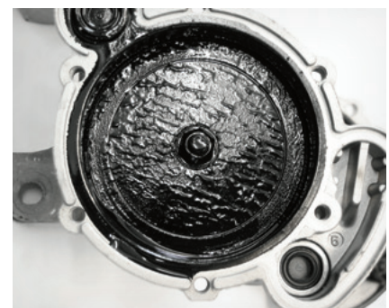
Fig. 3: La morchia nella pompa per vuoto di un VW Transporter produce un picchiettò

Una contestazione simile si verifica anche quando viene montata una pompa per vuoto errata con una punteria troppo corta (03).