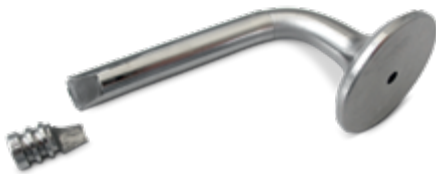
Fig. 1: rotura violenta en la escotadura

Siempre vuelve a ocurrir que tras una reparación de culata, después de poco tiempo, se produce una rotura de válvulas en el área de las piezas cónicas de la válvula (Fig. 1). Sobre todo en válvulas con un diámetro de la falda de 7 mm o menos.